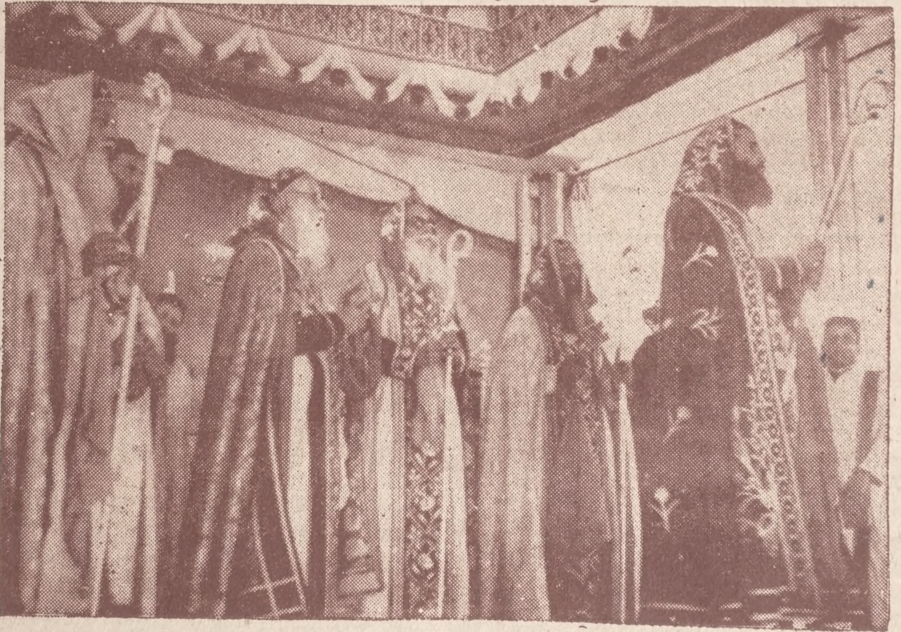
മെല്ല്യാസ്ഥാനാഭിഷിക്തരായ ശേഷം അഭിനവതിരുമേനിക്കാർ അംശവടിയുയർത്തി ജനക്കൂട്ടത്തെ ആശീർവ്വദിക്കുന്നു.