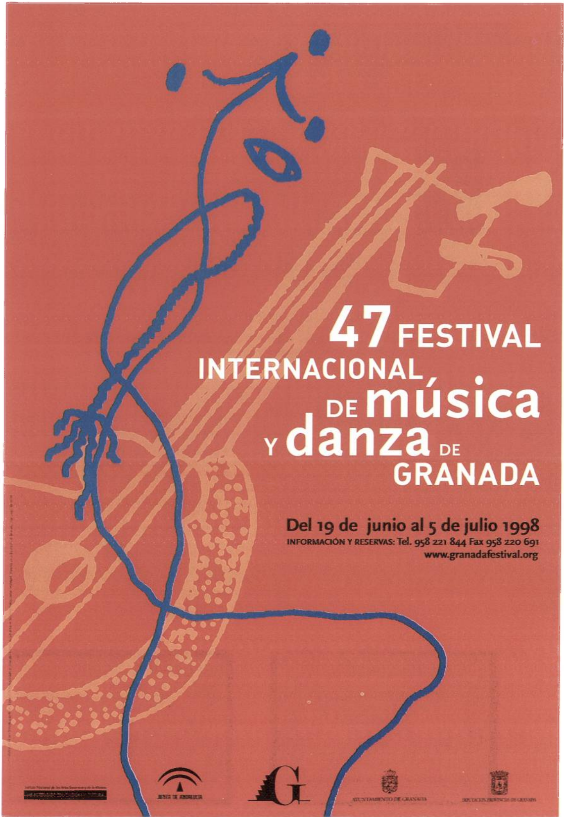
Saura y Torrente, sobre Federico García Lorca. Cartel del 47 Festival. (FIMDG)